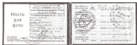
при оформлении в билетных кассах и пригородных поездах

Для оформления абонементного билета дополнительно предоставляется именной электронный носитель «Карта учащегося».