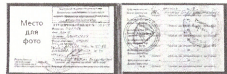
при оформлении абонементных билетов и разовых билетов в терминалах самообслуживания

Для оформления в терминалах самообслуживания разового проездного документа (билета) необходим электронный носитель, при контроле проезда в поездах пригородного сообщения предъявляется студенческий билет (с фотографией) и электронный носитель